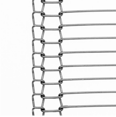
Banda metálica de alambres engarzados con orilla doble (TDA)