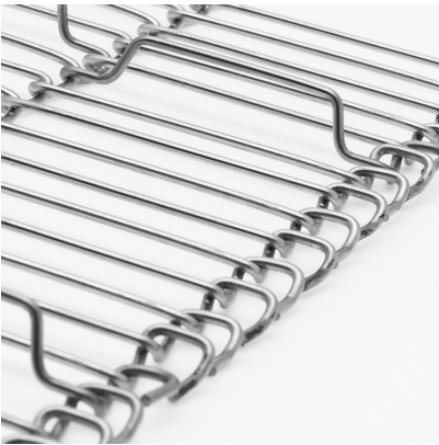
Banda metálica de alambres engarzados con arrastradores (TDA)