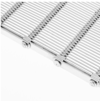
Banda metálica de malla gancho (CMG)