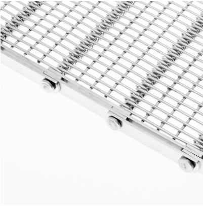
Banda metálica de malla gancho con varilla electrosoldada (CMG-VE)