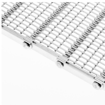
Banda metálica de malla gancho con varilla electrosoldada (CMG-VE)