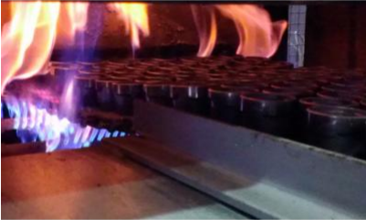
bandas para sinterizado